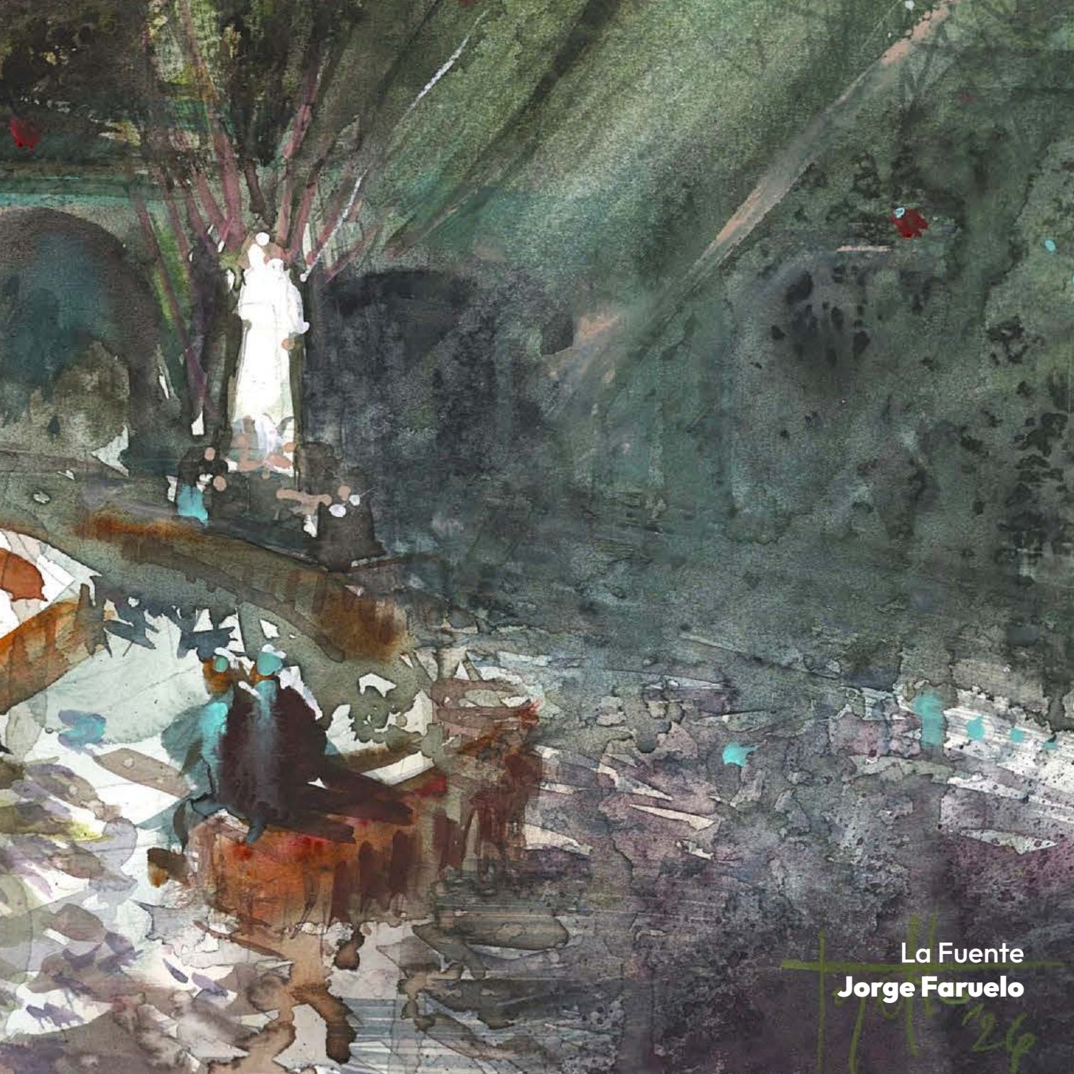
La Fuente Jorge Faruelo